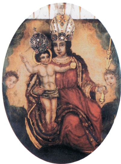
Majka Božja Kamenitih vrata Zaštitnica Grada Zagreba